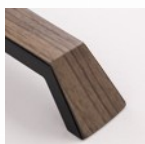
Multi Finitura [con film]